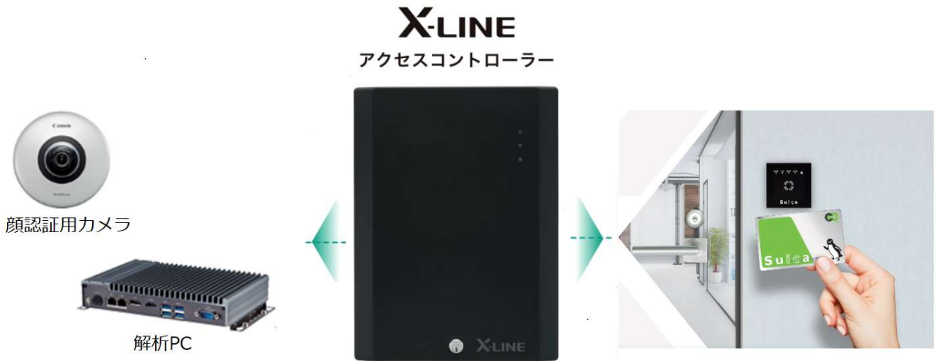
【 キヤノン独自開発の顔認証システム 】

+ 「 キヤノン独自開発の AI 顔認証技術を利用したネットワークカメラシステム 」