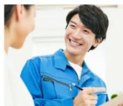
24時間365日対応の 保守サービスも有償でご用意