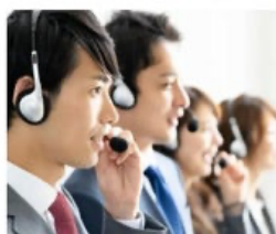
フリーコールで問合せ可能な サポートセンターを完備

アート製品のサポートにつきましては、当社の全国サービスネットワークにより製品のご相談から設置・施工・電話サポート・オンサイト修理など、みなさまに満足して頂けるサービスを提供いたします。また、24時間365日の電話サポート・オンサイト対応・機器保証など更に充実したサービスを受ける事ができる保守サービスも有償でご用意しております。セキュリティ機器メーカーとして歴史を刻んできた我々だからこそ実現できるサービスです。