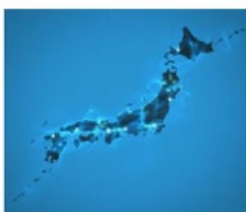
全国のサービスネットワークにより 故障時の修理対応が可能