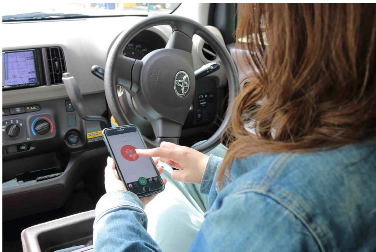
<シェアゲート利用イメージ図>